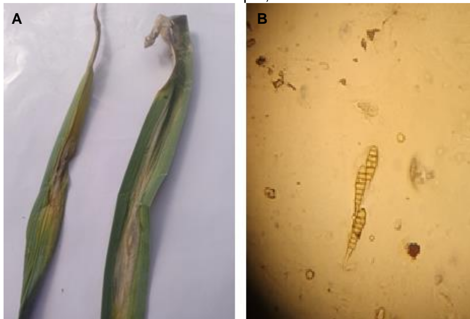
Figura 4. (A) Alho-bravo ( Allium ampeloprasum ) apresentando sintomas de mancha-púrpura, causada por Alternaria sp.; (B) esporos de Alternaria sp. observados ao microscópio, sob aumento 400x.