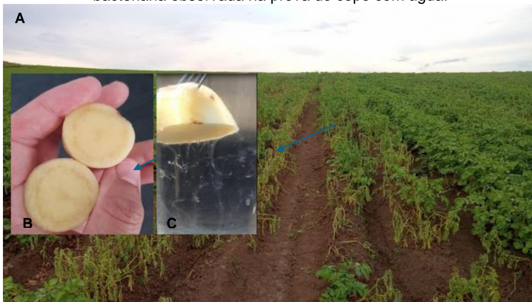
Figura 1. (A) Lavoura de batateira ( Solanum tuberosum ) apresentando reboleiras com sintomas típicos de Ralstonia sp.; (B) tubérculo de batateira seccionado transversalmente, evidenciando necrose nos feixes vasculares; (C) exsudação bacteriana observada na prova do copo com água.

auxiliam na interpretação dos dados obtidos e reforçam a importância do diagnóstico adequado no manejo das culturas.