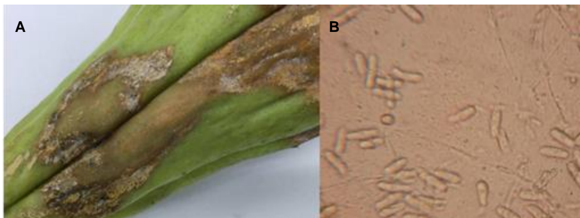
Figura 2. (A) Chuchu ( Sechium edule ) apresentando sintomas típicos de antracose, causada pelo fungo Colletotrichum sp; (B) esporos de Colletotrichum sp., observados ao microscópio, sob aumento de 800x.