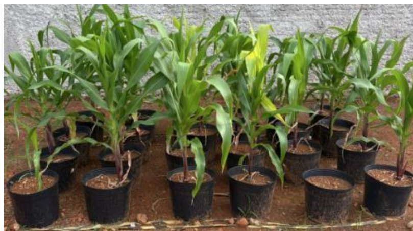
Figura 1: Milhos em vasos aos 67 dias após a semeadura

Para avaliar o cultivo de milho em vasos sob diferentes formulações de NPK, foram analisados: i) a taxa de germinação, ii) crescimento em altura e diâmetro das plantas e iii) a matéria seca. As avaliações do crescimento em altura e diâmetro; e do peso verde foram realizadas aos 67 dias após a semeadura (DAS) (Figura 1). Na mesma data, o material foi conduzido à estufa para determinação da matéria seca (MS).