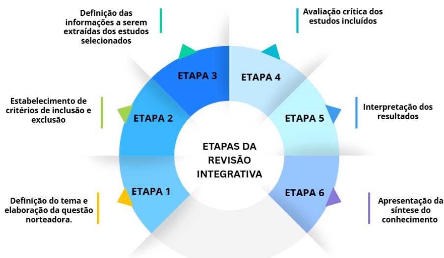
Figura 1 - Etapas da revisão integrativa

Fonte: Elaborado pelos autores (2026). Baseado em Camargo Júnior et al. , (2023).