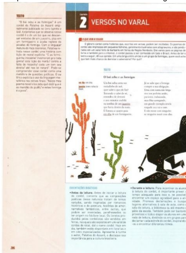
Figura 1: Sequências discursivas de livro didático de Língua Portuguesa